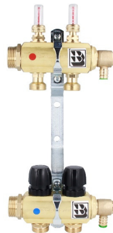
Rys. 1 Rozdzielacz mosiężny